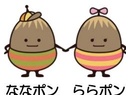
ななポン ららポン